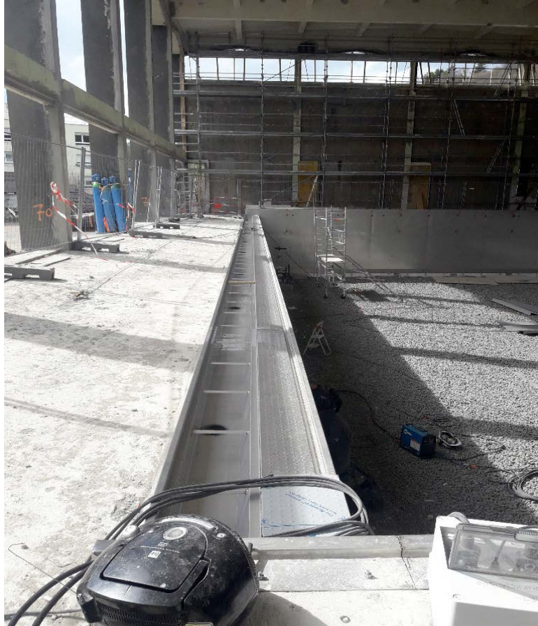
La mise en place de l'inox sur le grand bassin (à l'exception du fond), est à présent terminée.