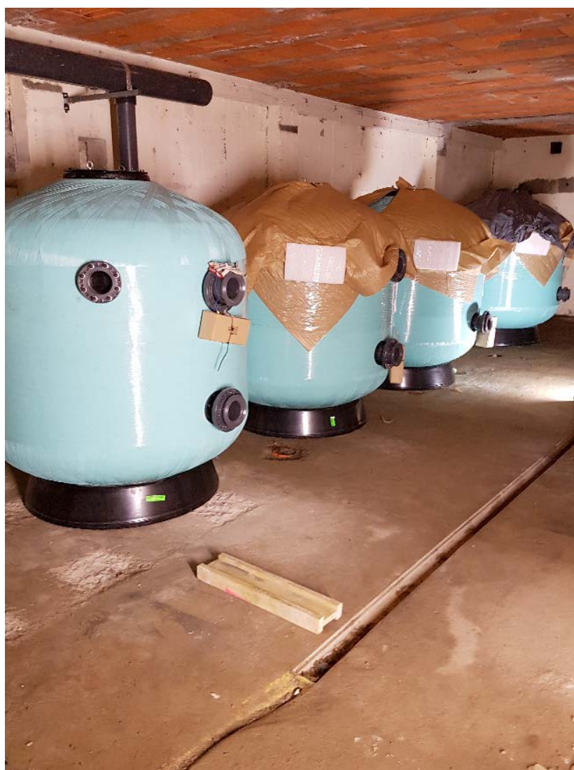
Filtres à sable

De jour en jour, votre piscine municipale prend forme et fait l'objet d'un suivi très attentif afin de proposer un équipement moderne, attractif et agréable.