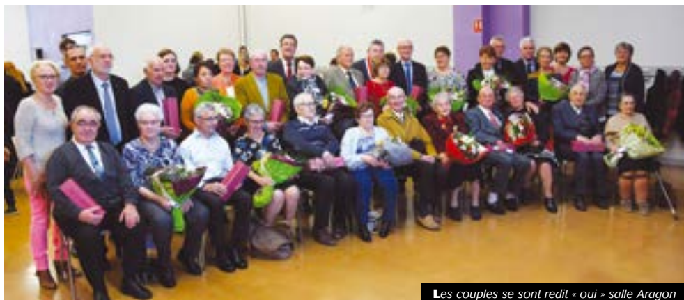
Les couples se sont redit « oui » salle Aragon

Depuis des années, le travail de cette association est reconnu par les différents organismes de santé et d'accompagnement de la Loire et de la région. C'est dans ce cadre que la CARSAT Rhône-Alpes (Caisse d'Assurance Retraite et de la Santé au Travail), a décidé d'octroyer une subvention de 11 134 € pour une aide à l'acquisition d'un minibus destiné au service de transport accompagné. Ce projet est également soutenu par la Caisse d'Épargne Loire Drôme Ardèche et le Rotary club de l'Ondaine. Une manière d'améliorer encore plus l'offre de services ainsi que les moyens d'une structure qui fait figure d'exemple dans le département.