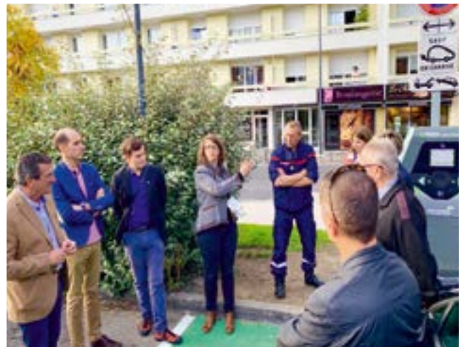
Mise en service de la borne de recharge de véhicules électriques