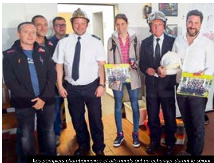
Les pompiers chambonnaires et allemands ont pu échanger durant le séjour

En juin 2020, ce sera au tour d'une délégation d'habitants d'Herzebrock-Clarholz de se rendre en terres chambonnaires, avec cette fois-ci des membres des services des espaces verts de la mairie allemande. Un jumelage décidément enrichissant à tout point de vue.