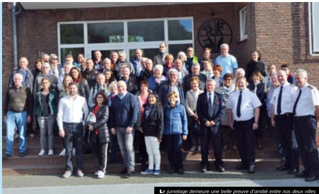
Le jumelage demeure une belle preuve d'amitié entre nos deux villes

Cette évolution concerne les emplacements zone bleue, matérialisés par un marquage au sol, situés dans les rues Gambetta, de la République, du 11 novembre et Grenette. Toute personne désirant s'y garer devra apposer un disque de stationnement visible depuis le tableau de bord de son véhicule. Ces disques peuvent être retirés gratuitement à l'accueil de la mairie du Chambon-Feugerolles.