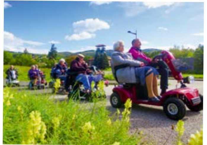
Sortie bucolique et « motorisée » sur la voie verte de l'Ondaine pour les résidents de la Résidence autonomie Quiétude