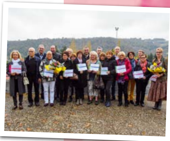
Remise des prix du concours « Chambon fleuri 2019 »