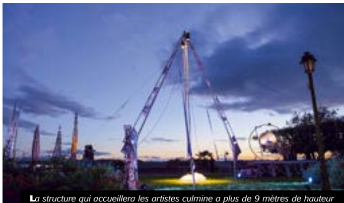
La structure qui accueillera les artistes culmine à plus de 9 mètres de hauteur

Sa réputation n'est aujourd'hui plus à faire. Partout en France ses représentations font mouche. Elle s'est même exportée à plusieurs reprises