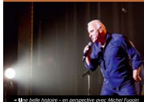
« Une belle histoire » en perspective avec Michel Fugain

On ne présente plus Michel Fugain. Il sera présent sur la scène de La Forge le vendredi 3 avril 2020 à 20h30 dans un spectacle intitulé « Les causeries musicales ». L'occasion de reprendre les plus grands succès de son répertoire. Des chansons inoubliables pour beaucoup à jamais gravées dans nos mémoires.