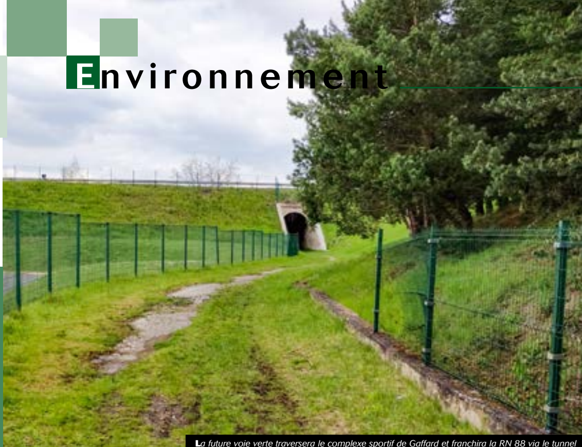
La future voie verte traversera le complexe sportif de Gaffard et franchira la RN 88 via le tunnel