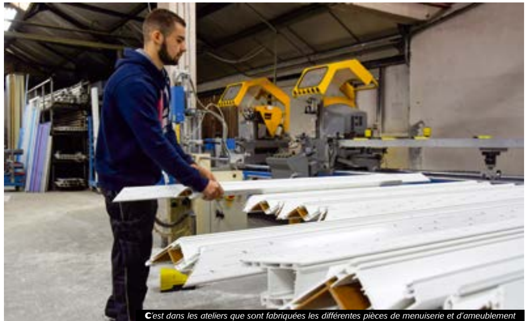
C'est dans les ateliers que sont fabriquées les différentes pièces de menuiserie et d'ameublement