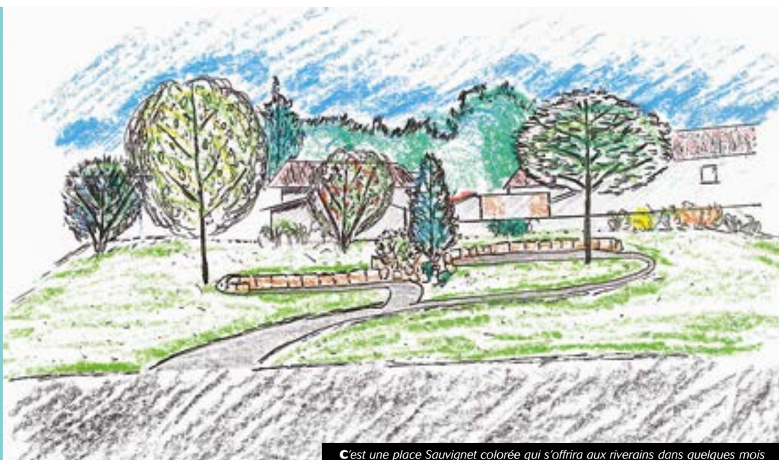
C'est une place Sauvignet colorée qui s'offrira aux riverains dans quelques mois

Un autre chantier s'est terminé en novembre dernier, celui de l'installation d'un ouvrage de décharge sur la rivière Malval, rue Jacquard. Ce nouvel équipement a été installé pour permettre de prévenir les difficultés liées à une crue de la rivière en cas d'intempéries. Le conduit existant a été remplacé par un pont cadre qui permet d'augmenter le débit de l'ouvrage en cas de fortes précipitations.