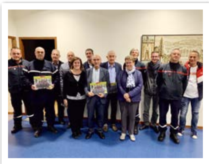
Présentation du calendrier 2020 des sapeurs-pompiers du Chambon-Feugerolles, proposé en porte à porte auprès de la population chambonnaire