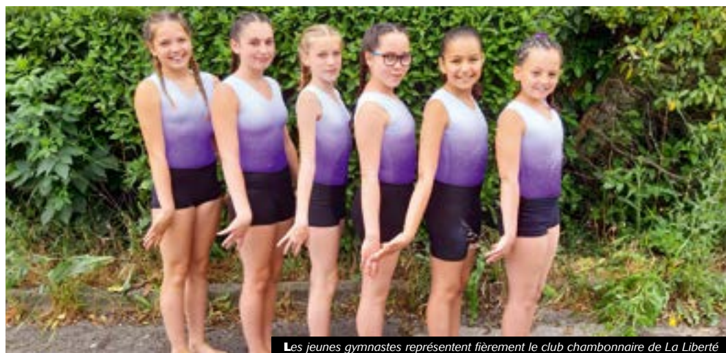
Les jeunes gymnastes représentent fièrement le club chambonnaire de La Liberté

L'un des plus anciens clubs de la ville, avec 150 années d'existence, s'illustre encore et toujours au point d'être devenu une référence au niveau local.