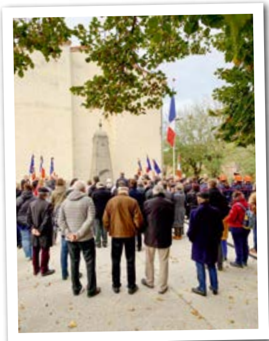
Cérémonie du 11 novembre pour se souvenir et rappeler l'importance d'une Europe en paix