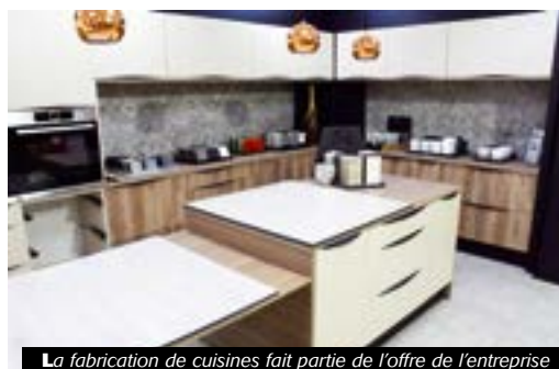
La fabrication de cuisines fait partie de l'offre de l'entreprise

46 rue Benoît Frachon Tél : 04 77 80 03 83