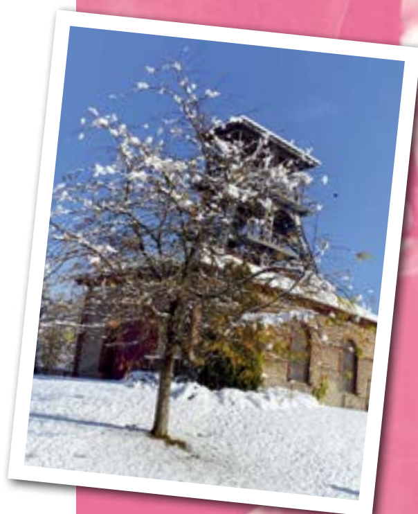
Instantané du Chambon-Feugerolles sous la neige le 15 novembre dernier