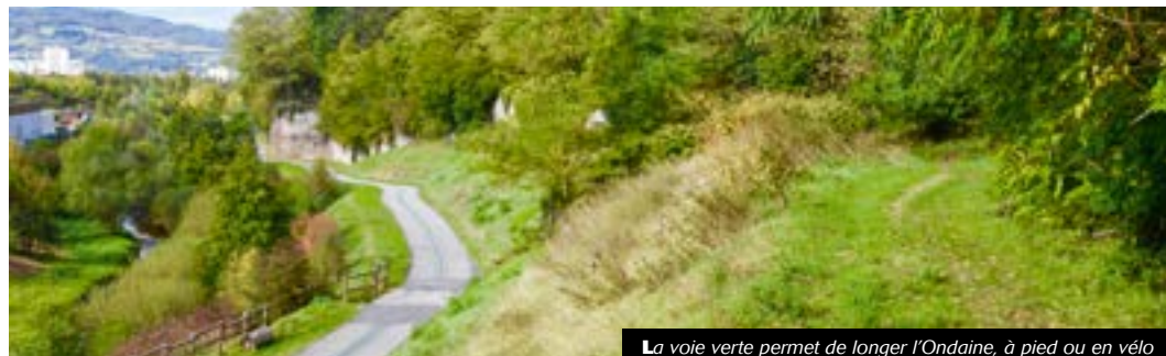
La voie verte permet de longer l'Ondaine, à pied ou en vélo

Les travaux de réalisation, soutenus par la Région Auvergne-Rhône-Alpes, devraient débuter fin décembre 2019 et s'inscrivent dans le plan vélo 2019-2029 de Saint-Étienne Métropole. Le Chambon-Feugerolles confirme ainsi son statut de commune pilote dans le déploiement de ces infrastructures.