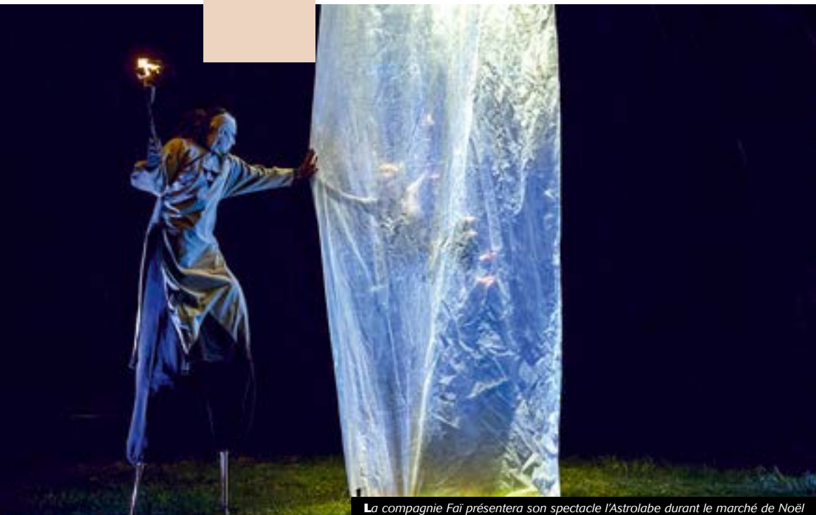
La compagnie Fai présentera son spectacle l'Astrolabe durant le marché de Noël