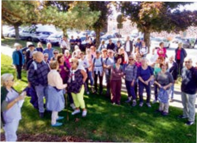
« Balade bleue » proposée par le Conseil communal des aînés, avec une promenade ensoleillée dans les quartiers de la ville