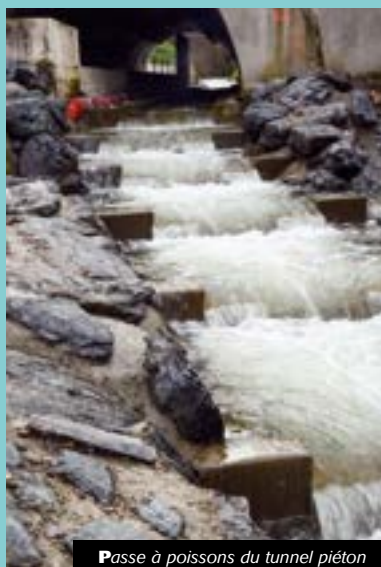
Passé à poissons du tunnel piéton

Deux « passes à poissons » ont été construites à Cotatay et sous le tunnel piéton reliant le parc Rousseau au Rabelais (sous la RN88). Le constat avait en effet été établi que les poissons n'avaient plus la possibilité de remonter le courant, créant ainsi une rupture écologique. C'est désormais corrigé, et grâce à la construction de plusieurs prébarrages, ils peuvent de nouveau remonter le courant pour pondre leurs œufs plus facilement.