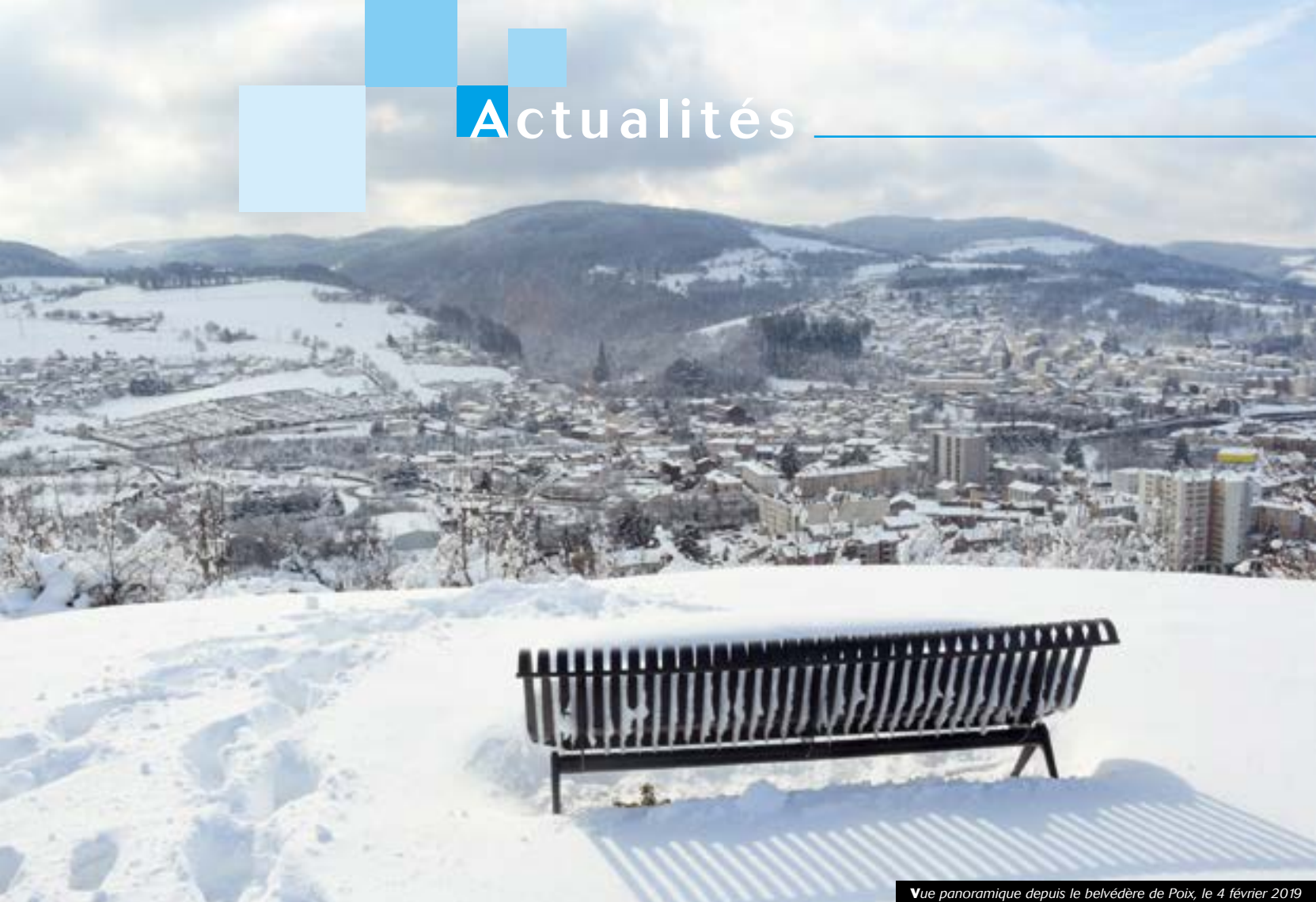
Vue panoramique depuis le belvédère de Poix, le 4 février 2019