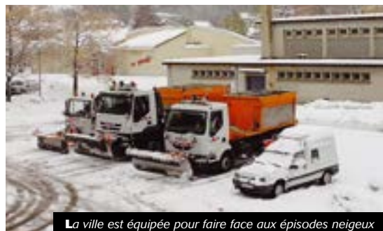
La ville est équipée pour faire face aux épisodes neigeux

Il est enfin rappelé que chaque citoyen est tenu de déneiger le trottoir devant son pas de porte. Par ailleurs et durant la période hivernale, dans le cadre du signalement d'une personne dormant dans la rue ou sans domicile, un numéro d'urgence, le 115, est mis à la disposition de chacun.