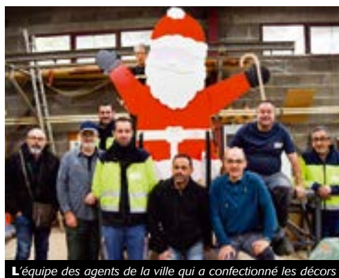
L'équipe des agents de la ville qui a confectionné les décors

Que ce soit sur l'espace festif, dans les commerces ou les rues chambonnaises, les festivités de Noël version 2019 devraient tenir toutes leurs promesses... et enchanter petits et grands.