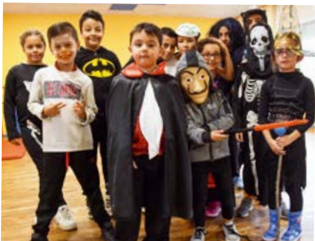
Les enfants des Centres de loisirs Acti'Mômes et du Rabelais déguisés pour fêter Halloween