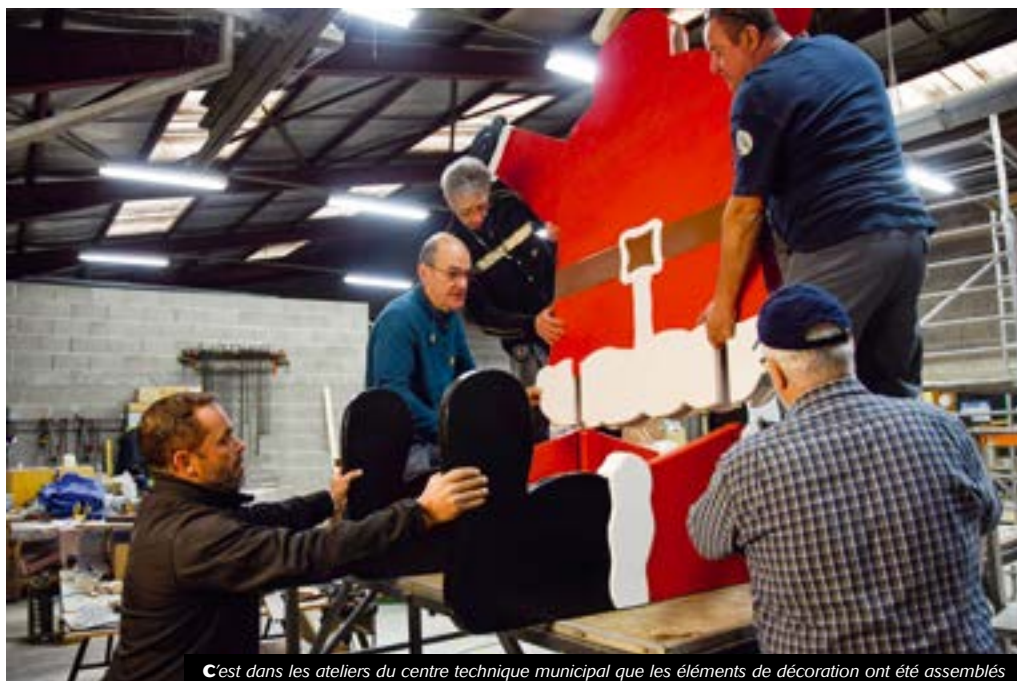
C'est dans les ateliers du centre technique municipal que les éléments de décoration ont été assemblés