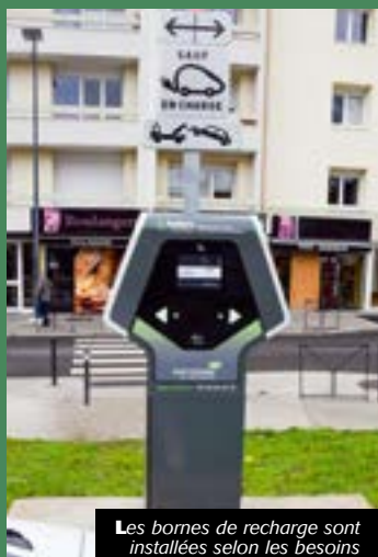
Les bornes de recharge sont installées selon les besoins

Une borne de recharge pour véhicules électriques, installée depuis quelques semaines sur le parking du Carrefour Market, complète l'offre sur la vallée de l'Ondaine. Saint-Étienne Métropole poursuit ainsi ce déploiement en proposant l'installation de bornes de recharge sur la voirie selon les besoins des usagers. Les personnes intéressées peuvent formuler une demande sur www.saint-etienne-metropole.e-totem.fr . Toutes les demandes seront ainsi étudiées et feront l'objet d'une réponse. Si tous les critères sont remplis, la borne sera installée sous 3 mois.