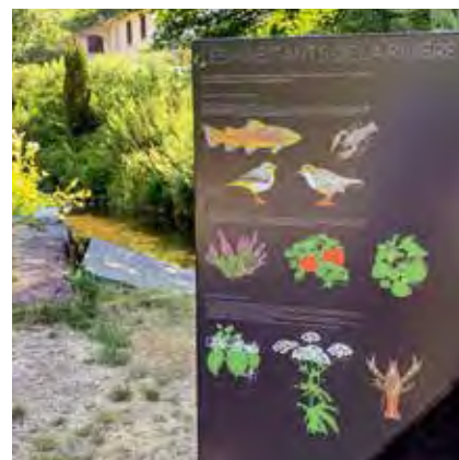
villelechambon Le week-end approche à grand pas... Et si vous preniez l'air dans la vallée de Cotatay à la découverte des habitants de la rivière ? #monchambon #ondaine @saintetiennemetropole #nature #riviere #biodiversité #balade @saintetiennemetropole