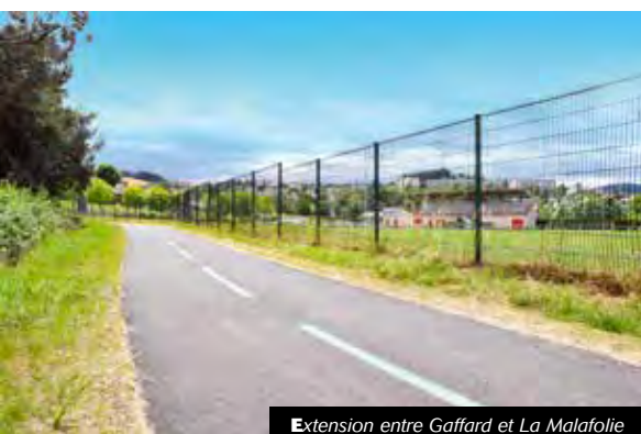
Extension entre Gaffard et La Malafolie

Des réalisations qui à cette heure portent à 7 le nombre total de kilomètres de voie verte, et qui font de la ville du Chambon-Feurolles un précurseur en matière de développement de ce que l'air du temps qualifie aujourd'hui de « mobilités actives ».