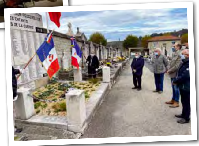
Cérémonie du souvenir Français, au cimetière municipal, le 1 er novembre dernier, pour honorer la mémoire de ceux qui ont donné leur vie pour la France.