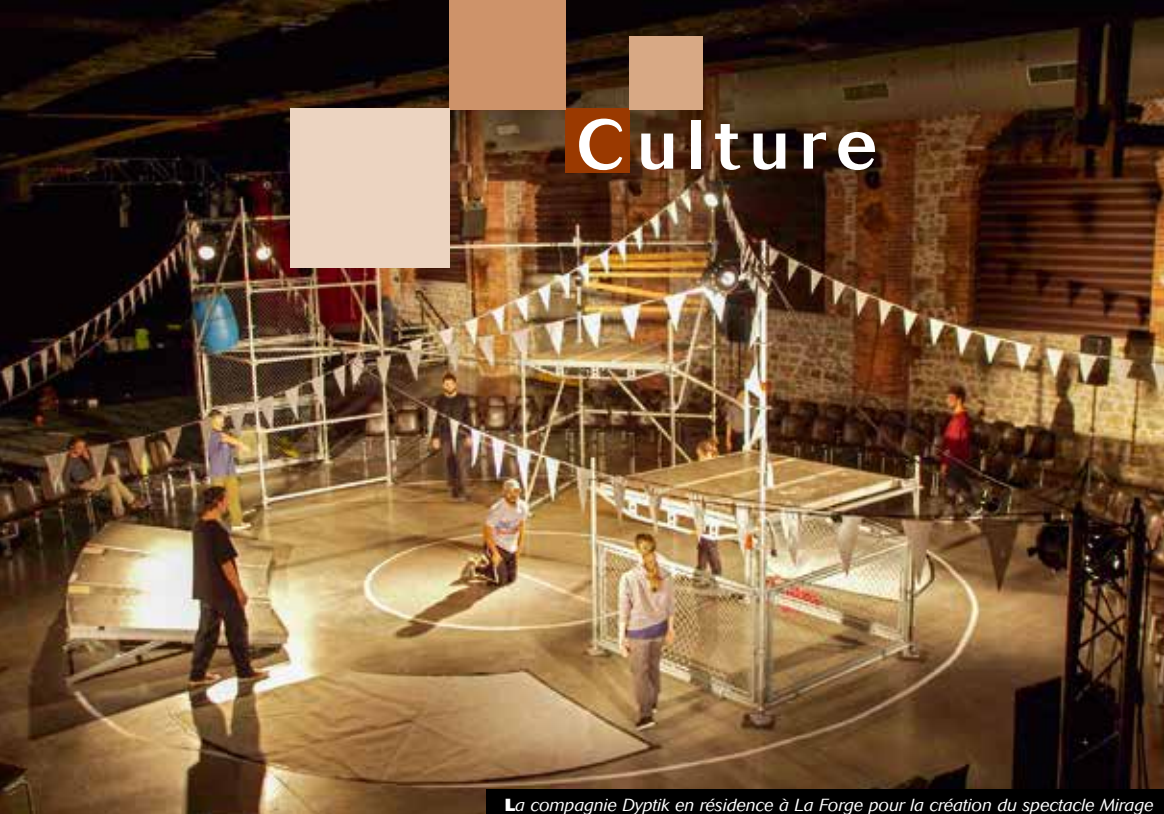
La compagnie Dyptik en résidence à La Forge pour la création du spectacle Mirage