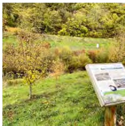
villelechambon Pour le plaisir des yeux... #monchambon se pare de ses couleurs d'automne : aujourd'hui les berges de l'ondaine #reconfinement #prenezsoindevous #voieverte @saintetiennemetropole @saintetiennemetropolehorscadre @loire_only @departementloire @auvergnerhonealpes.tourisme @region_auvergnerhonealpes