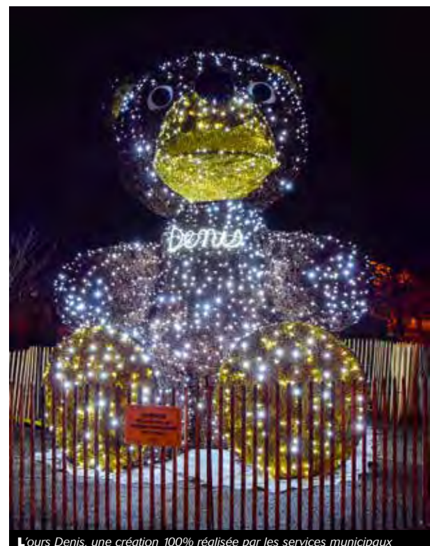
L'ours Denis, une création 100% réalisée par les services municipaux

Quant au Père-Noël, il attend patiemment la nuit de Noël devant la maison de retraite de l'hôpital Claudinon au côté de ses rennes, pour le plus grand plaisir des résidents et du personnel de l'établissement très satisfaits de voir s'installer ce drôle de voisin. La féerie de Noël sera donc belle et bien présente... De quoi redonner du baume au cœur aux petits comme aux grands.