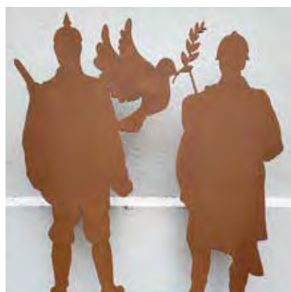
villelechambon Focus sur le talent des agents de la Ville #monchambon avec cette belle réalisation #paix parc Jean Jaurès pour commémorer l'armistice #premièreguerremondiale #1418 #19141918 #war1418 #11novembre1918 #paix #poilus #bleuet, rendre hommage et ne jamais oublier #devoirdememoire