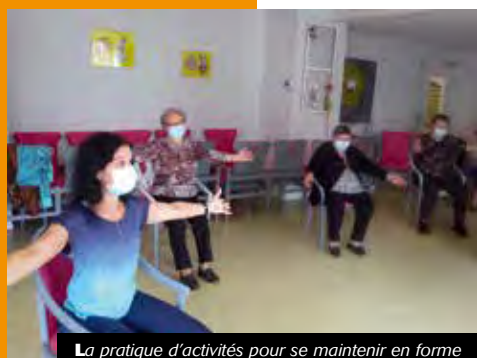
La pratique d'activités pour se maintenir en forme