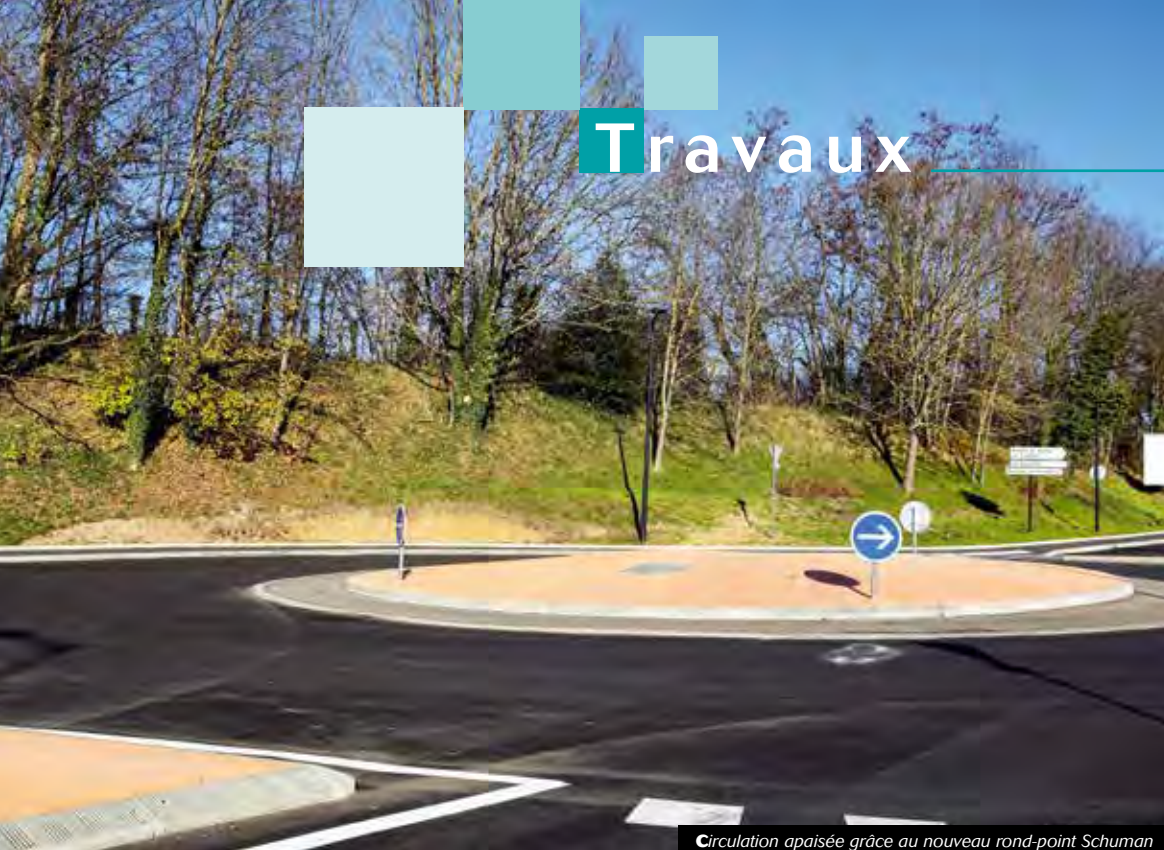
Circulation apaisée grâce au nouveau rond-point Schuman