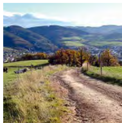
villelechambon Belle journée pour profiter des chemins de traverse sur les hauteurs de #monchambon @saintetiennemetropole #sémlemag #ondaine #saintetiennemetropole @tourisme42 @departementloire @auvergnerhonealpes.tourisme