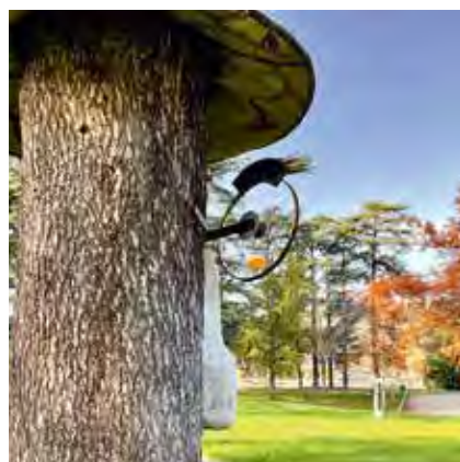
villelechambon Un drôle de Chambonnaire veille sur le parc de La Pouratte sous le soleil de ce samedi en mode #confiné #confinement #prenezsoindevous. Partagez vos plus belles photos de @villelechambon avec le hashtag #monchambon @saintetiennemetropole @saintetiennehorscadre #sémlemag @loire_only @departementloire @auvergnerhonealpes.tourisme