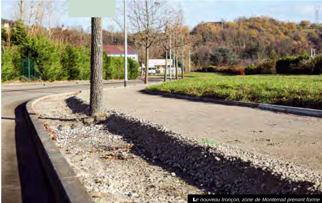
Le nouveau tronçon, zone de Montrrad prenant forme