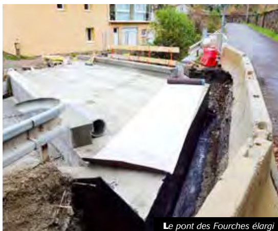
Le pont des Fourches élargi

Voilà un beau cadeau qui devrait être livré en janvier 2021 si le temps reste de la partie. Ce n'est plus qu'une question de jours pour que le nouveau pont des fourches puisse enfin être emprunté. Totalement reconstruit avec une largeur plus importante, il répondra aux exigences du passage de crues centennales et apportera un plus grand confort aux riverains et randonneurs.