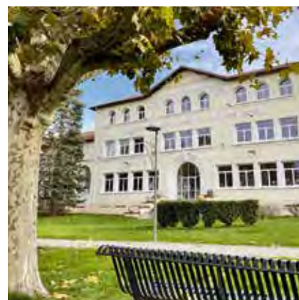
villelechambon Partagez vos plus belles photos de @villelechambon avec le hashtag #monchambon : ici les premiers signes de l'automne avec l'école Louis Pasteur dans le quartier de La Romière @saintetiennemetropole #automne #sémlemag #ondaine #ondaine #saintetiennemetropole @tourisme42 @departementloire @auvergnerhonealpes.tourisme