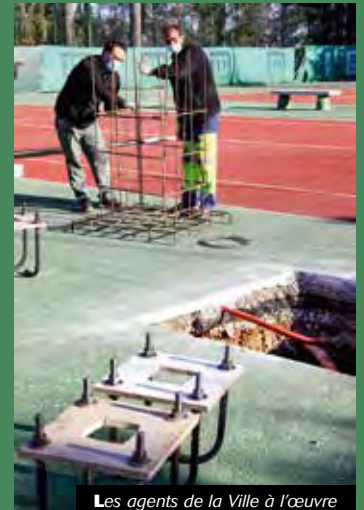
Les agents de la Ville à l'œuvre

L'éclairage des quatre courts de tennis municipaux fait peu de bruit, pour la plus grande satisfaction des pratiquants amateurs. Des travaux réalisés par les agents de la Ville et qui devraient se terminer courant janvier 2021.