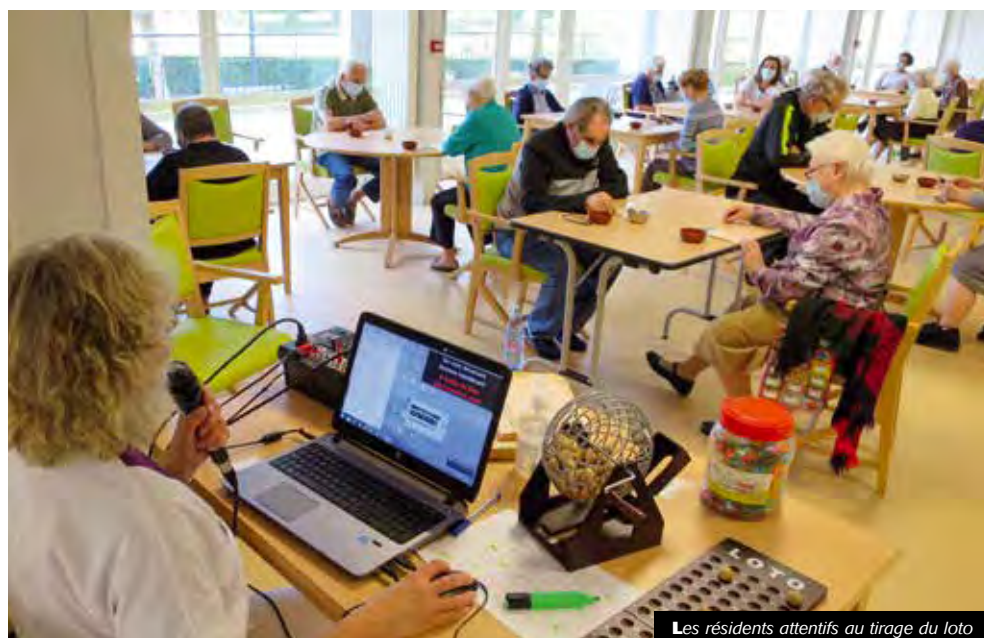
Les résidents attentifs au tirage du loto

Mais tout cela n'est que partie remise et tout est fin prêt pour une reprise dès lors que le contexte sanitaire le permettra.