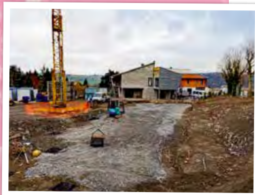
Le chantier de création d'un institut médico-éducatif, couplé à l'extension de la résidence Transverse avance, pour une mise en service fin 2021.