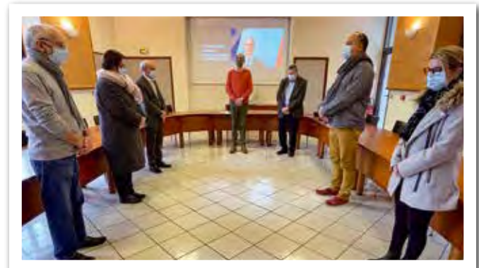
Hommage à Valéry Giscard d'Estaing, ancien Président de la République française.