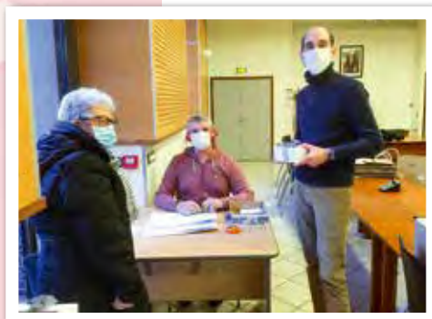
Traditionnelle distribution de chocolats aux seniors Chambonnais par les élus de la Ville.