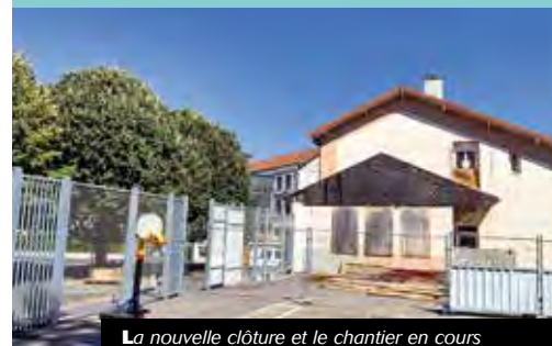
La nouvelle clôture et le chantier en cours

Autre chantier qui se déroule sous les meilleurs auspices : la réhabilitation du foyer laïque. Suite à la reprise du toit en 2019, la liste des travaux engagés récemment est importante avec la reprise totale de la partie électrique, l'aménagement de sanitaires en intérieur (avec accès aux personnes à mobilité réduite), la création d'un ascenseur, la réfection des huisseries, la pose d'un nouveau carrelage et la mise en peinture. Une véritable cure de jouvence pour ce bâtiment emblématique, qui devrait prendre fin début 2021.