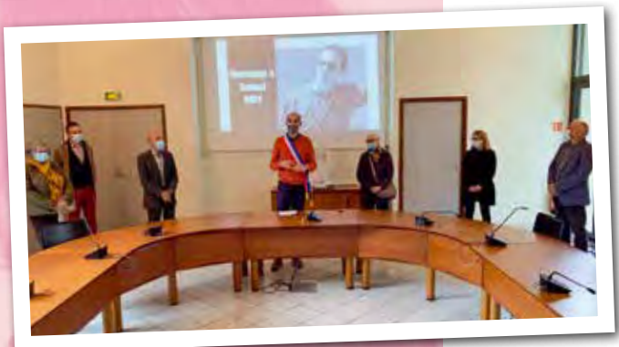
En hommage à la mémoire de Samuel Paty, cet enseignant assassiné lors d'une attaque terroriste le 16 octobre 2020, les drapeaux de l'Hôtel de ville du Chambon-Feugerolles ont été mis en berne et une minute de silence observée en mairie.