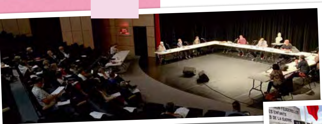
Réunion du conseil municipal dans un lieu inhabituel... mais adapté au contexte sanitaire puisque permettant aux 33 élus de respecter les gestes barrières : l'Espace culturel Albert Camus.