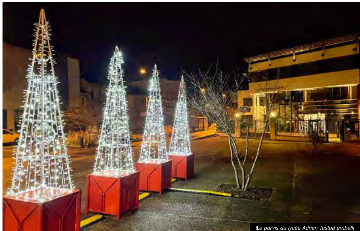
Le parvis du lycée Adrien Testud embelli