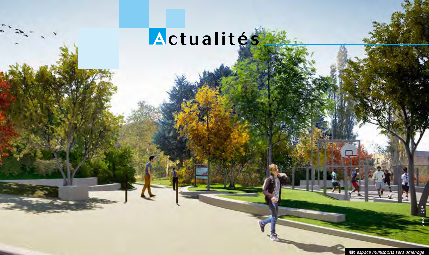
Un espace multisports sera aménagé