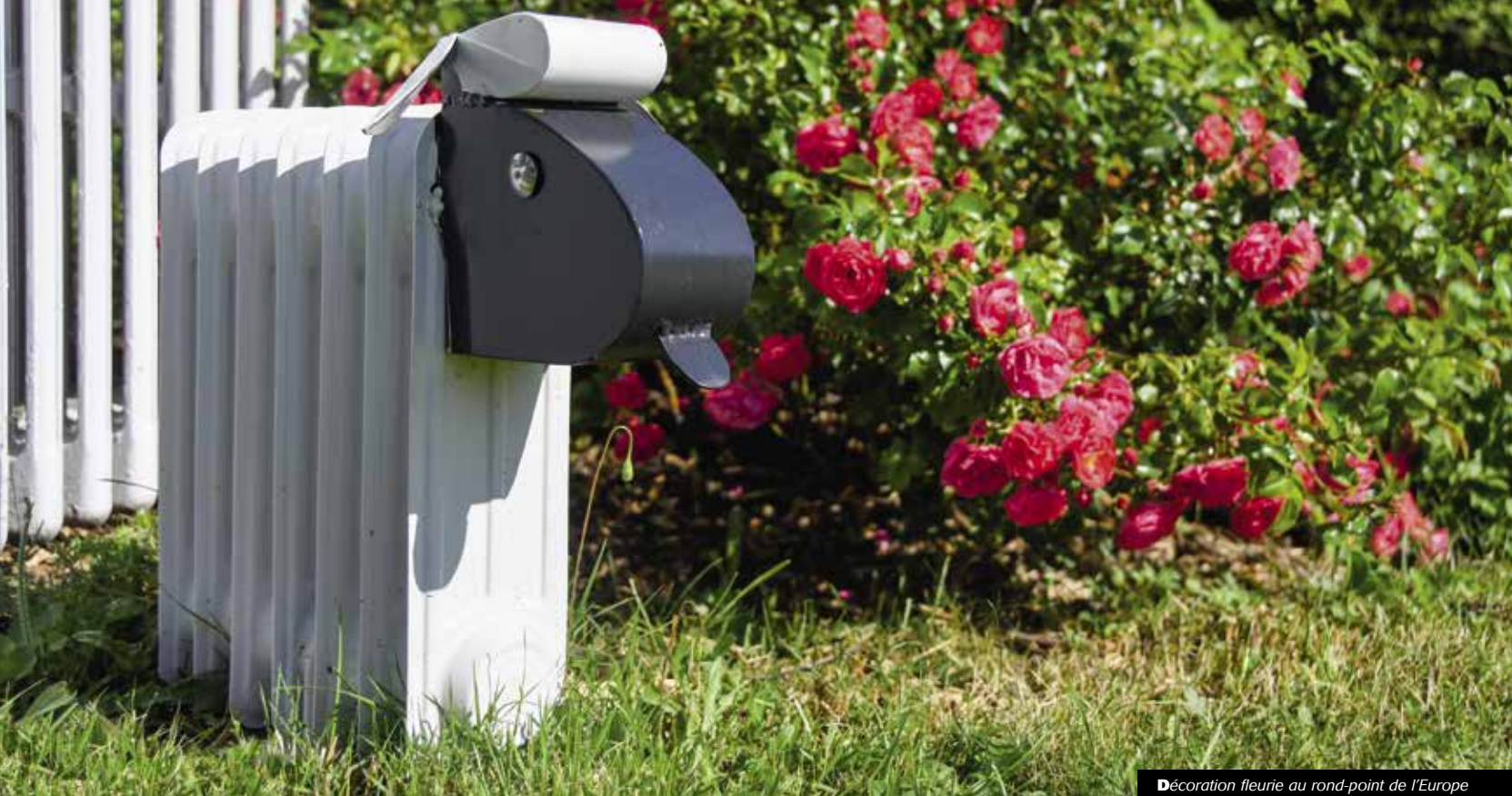
Décoration fleurie au rond-point de l'Europe