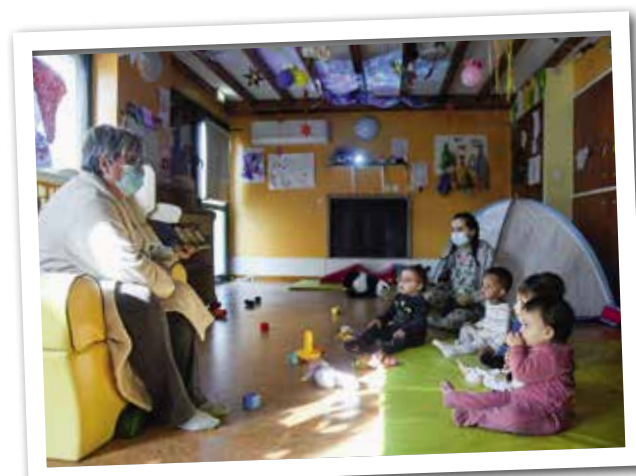
Venir à la crèche en pyjama : un rêve devenu réalité le temps d'une journée pour les bambins de la crèche Les Pirouettes... tout comme pour le personnel !