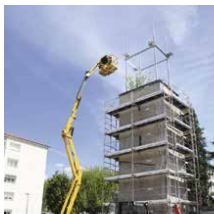
villelechambon Les travaux sur l'esplanade du Bon Pasteur se concrétisent... avec l'arrivée de la végétation et des arbres plantés... au sommet du campanile !