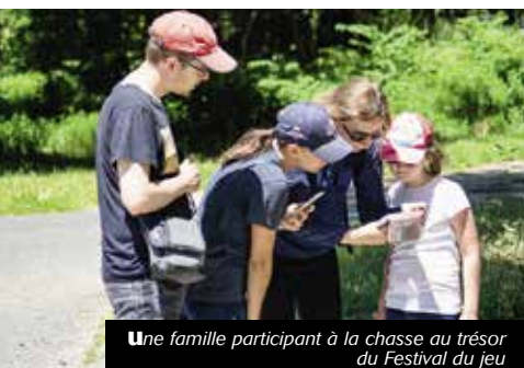
Une famille participant à la chasse au trésor du Festival du jeu

Comme ce fut le cas le 26 juin, avec le traditionnel Festival du jeu. Les enfants ont pu participer à différents ateliers et jeux en plein air, que ce soit au parc Jean Moulin ou dans les cours de l'école Jean Jaurès. Une belle réussite, pour le plus grand plaisir du millier de personnes qui se sont succédées au fil de la journée sur les 16 stands, sans jamais dépasser les jauges autorisées. Autre temps fort inédit de cette édition avec la grande chasse au trésor numérique. Chaque participant a ainsi dû trouver la combinaison du cadenas ouvrant un mystérieux coffre, en suivant les instructions d'un manuscrit, pour en découvrir le trésor et repartir avec !