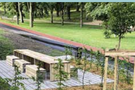
Le nouveau parc du Bouchet prêt à recevoir le public

C'est donc fait. Le parc du Bouchet vient de faire peau neuve, il est de nouveau accessible aux sportifs et aux promeneurs. Ne perdez plus une seconde pour découvrir son nouveau visage, pour un moment garanti 100% plaisir.