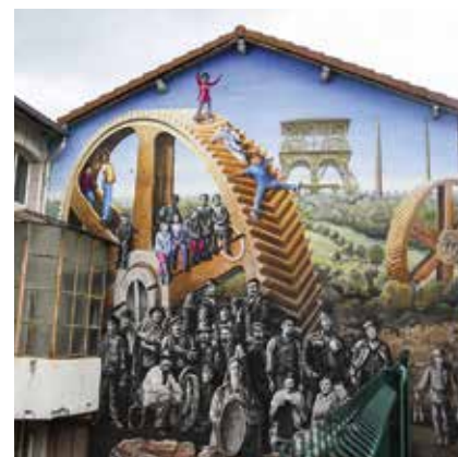
villelechambon Une page de l'histoire de @villelechambon #lechambonfeugerolles #monchambon résumée en une fresque #murspoints ornant le mur de l'école Lamartine