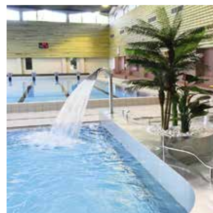
villelechambon Envie de fraîcheur ? Le Centre aquatique de l'Ondaine vous accueille pour quelques longueurs, profiter du petit bassin pour les enfants ou bien encore prendre le soleil sur l'espace extérieur. Horaires, tarifs et inscriptions sur le site internet de la ville www.lechambon.fr