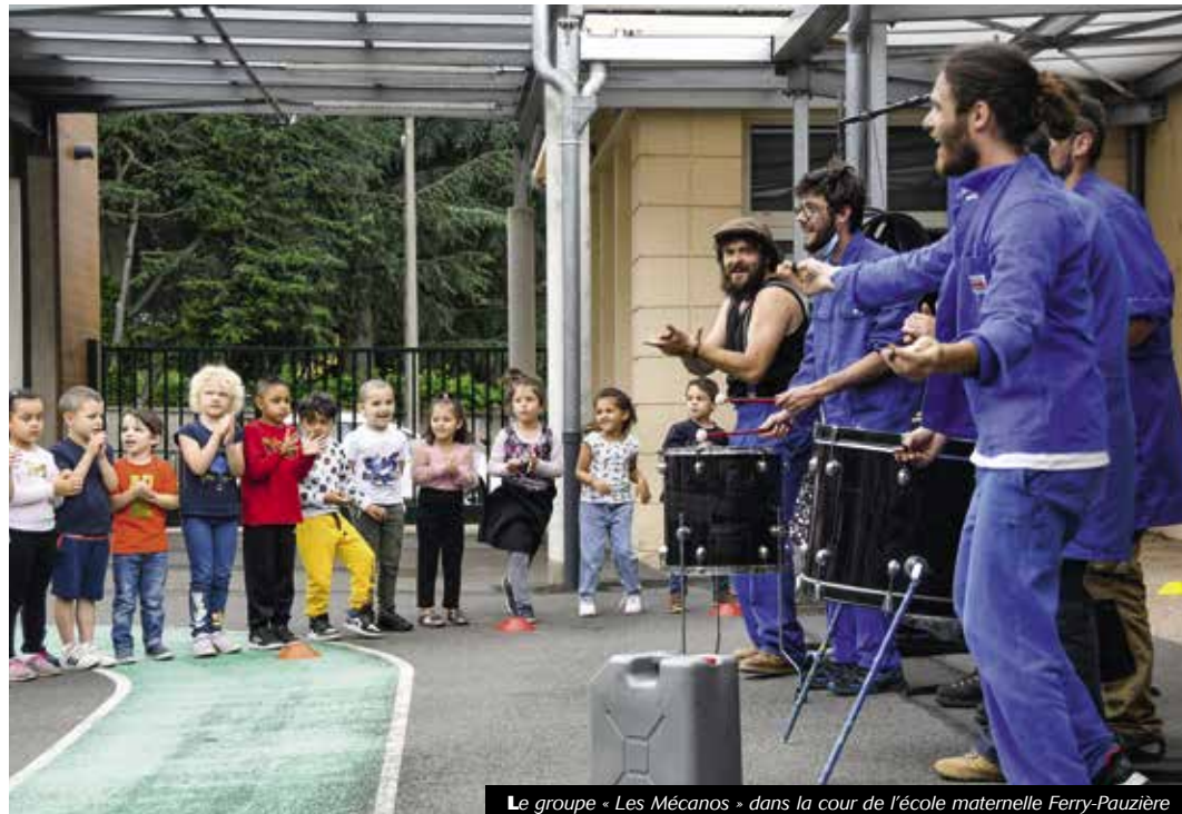
Le groupe « Les Mécanos » dans la cour de l'école maternelle Ferry-Pauzière