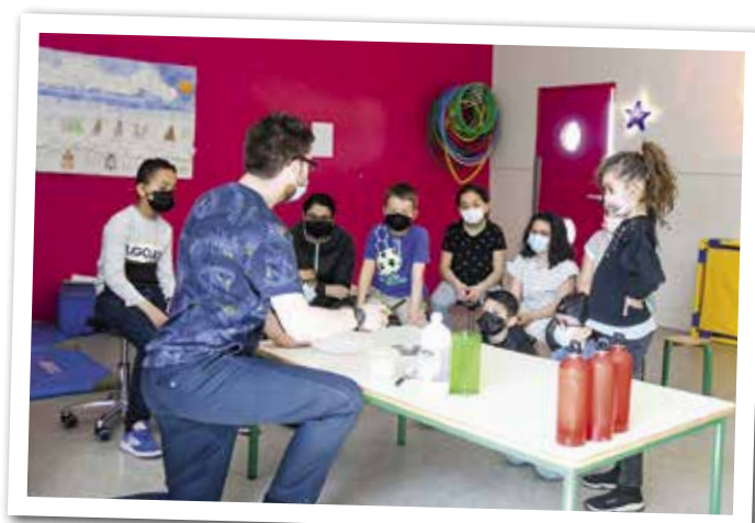
Direction Mars ! Chez Acti'mômes, un intervenant de la Rotonde de l'École des mines est venu présenter la planète rouge aux jeunes astronomes.