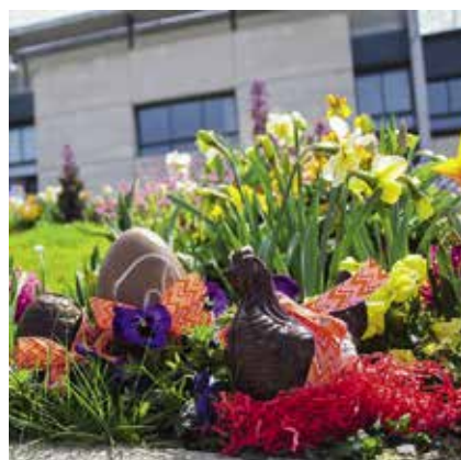
villelechambon Drôle de découverte dans les massifs de fleurs de la ville : les poules et œufs en chocolat de nos commerçants en profitent pour se balader... mais gare au soleil !