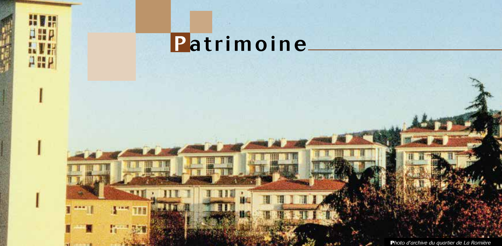
Photo d'archive du quartier de La Romière