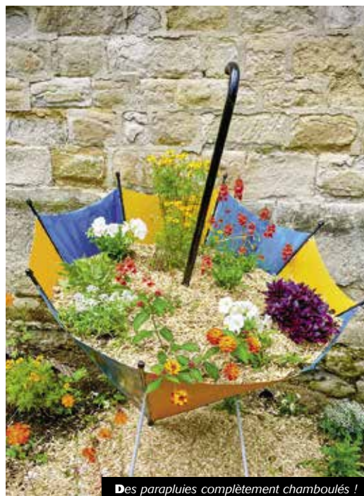
Des parapluies complètement chamboulés !

Ce que l'on peut voir aujourd'hui ne ressemblera pas à ce qui sera visible demain... Puisque d'ici quelques jours, les plantes et les fleurs auront poussé, donnant ainsi une tout autre dimension aux installations.