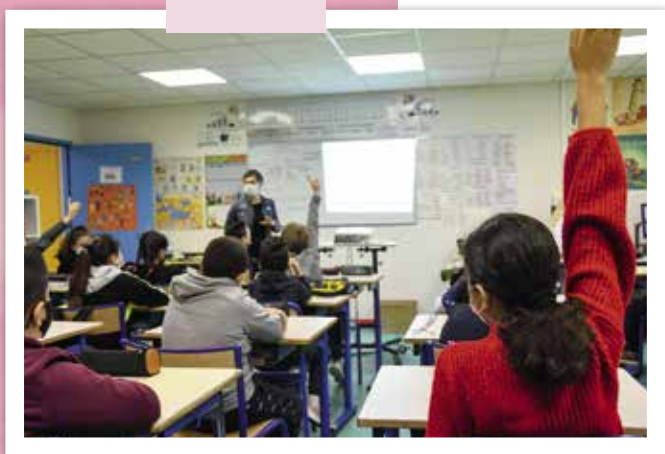
Les élèves de l'école Jules Ferry curieux de découvrir le projet d'éco-quartier des Molières dans le cadre d'un projet scolaire sur l'urbanisme.