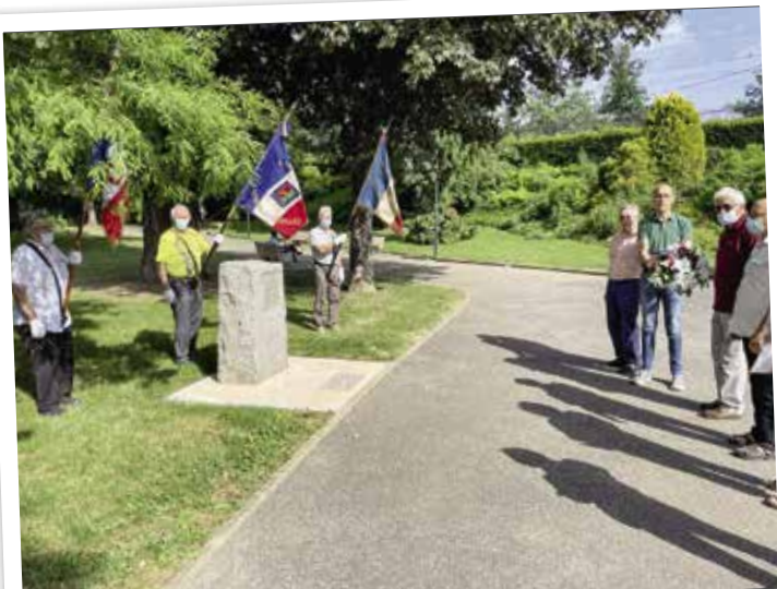
Cérémonie de commémoration de l'Appel du 18 juin du général de Gaulle dans l'émotion et le recueillement.