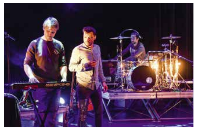
L'Espace culturel Albert Camus accueille régulièrement de nombreux artistes qui souhaitent répéter leurs futurs spectacles. Ces derniers mois, ont été accueillis pèle-mêle la troupe de théâtre Quincaillerie Moderne, la Baroufada qui enregistrait en studio, ou encore le groupe de musique Alkabaya qui répétait sur scène.