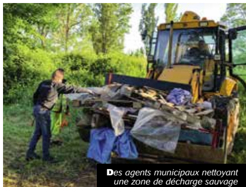
Des agents municipaux nettoyant une zone de décharge sauvage

La Ville fait appel à la conscience de tous pour réduire ces décharges sauvages et ainsi améliorer le cadre de vie de chacun.