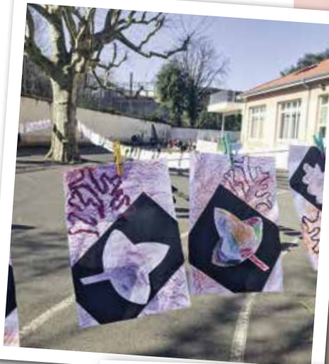
Plusieurs écoles du Chambon-Feugerolles ont participé à « La Grande Lessive ». Le projet artistique international définit chaque année un thème qu'il convient d'illustrer par des dessins qui sont ensuite affichés en extérieur sous la forme d'une grande lessive, (avec corde et pince à linge). En 2021, le thème était « Jardin suspendus ».