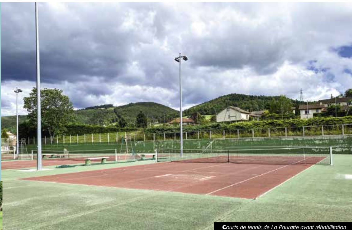
Courts de tennis de La Pouratte avant réhabilitation