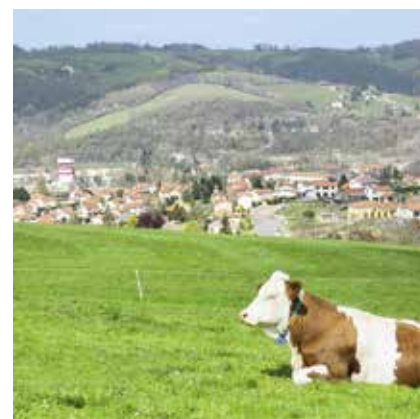
villelechambon Promenade bucolique à travers les chemins du Chambon-Feugerolles, pour découvrir la ville autrement... et faire de belles rencontres... Dans le respect du rayon de 10km autour de son domicile