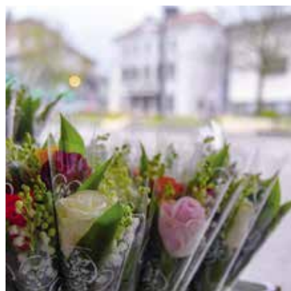
villelechambon Une dose de bonheur pour soi ou pour offrir ! Les fleuristes du Chambon-Feugerolles sont sur la place Jean Jaurès aujourd'hui et demain avec des brins de muguet simples ou composés