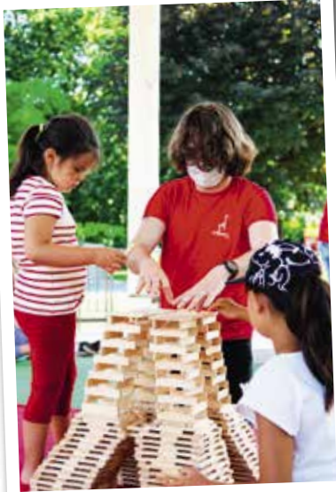
L'édition 2021 du Festival du jeu a tenu toutes ses promesses pour le plus grand bonheur de plus de 1 000 petits et grands présents tout au long de la journée.