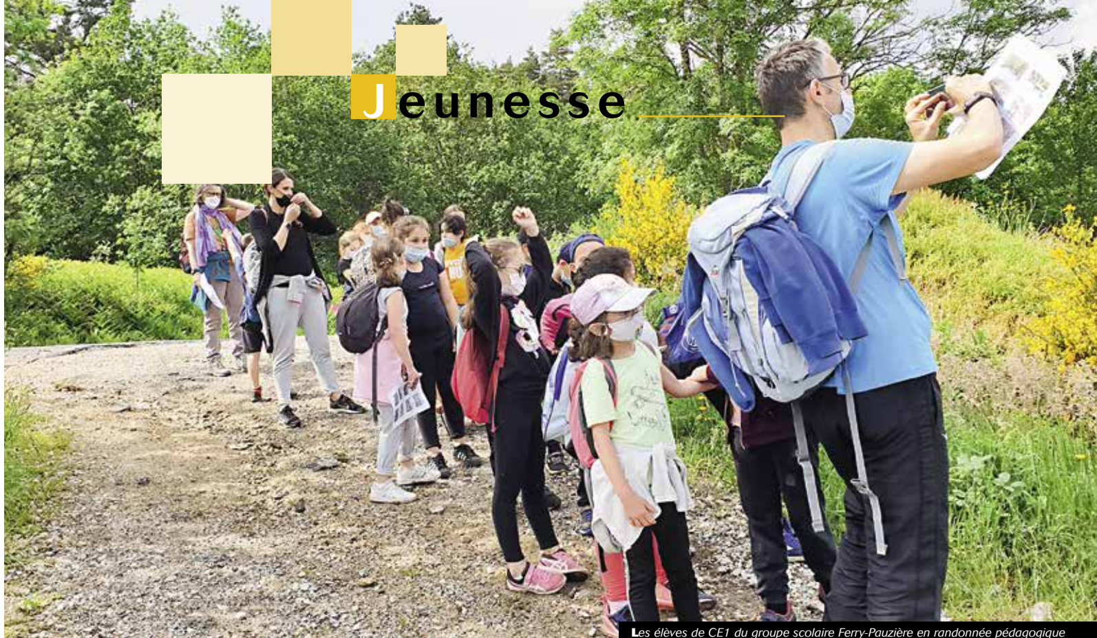
Les élèves de CE1 du groupe scolaire Ferry-Pauzière en randonnée pédagogique