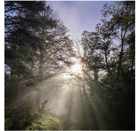
villelechambon Randonnée dominicale sous le soleil qui perce la brume matinale dans la forêt du Chambon-Feugerolles.