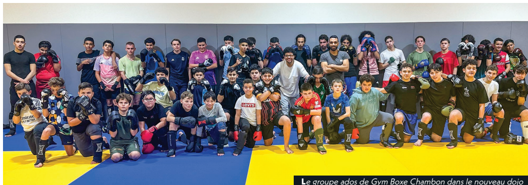
Le groupe ados de Gym Box Chambon dans le nouveau dojo

Les entraînements se déroulent les mercredis, vendredis et samedis matin dans le tout nouveau dojo du complexe sportif Porte du Pilat. Ce lieu entièrement équipé de tatamis offre un cadre idéal pour pratiquer cette discipline. Lors de l'inauguration officielle du complexe le 23 novembre dernier, le club a d'ailleurs