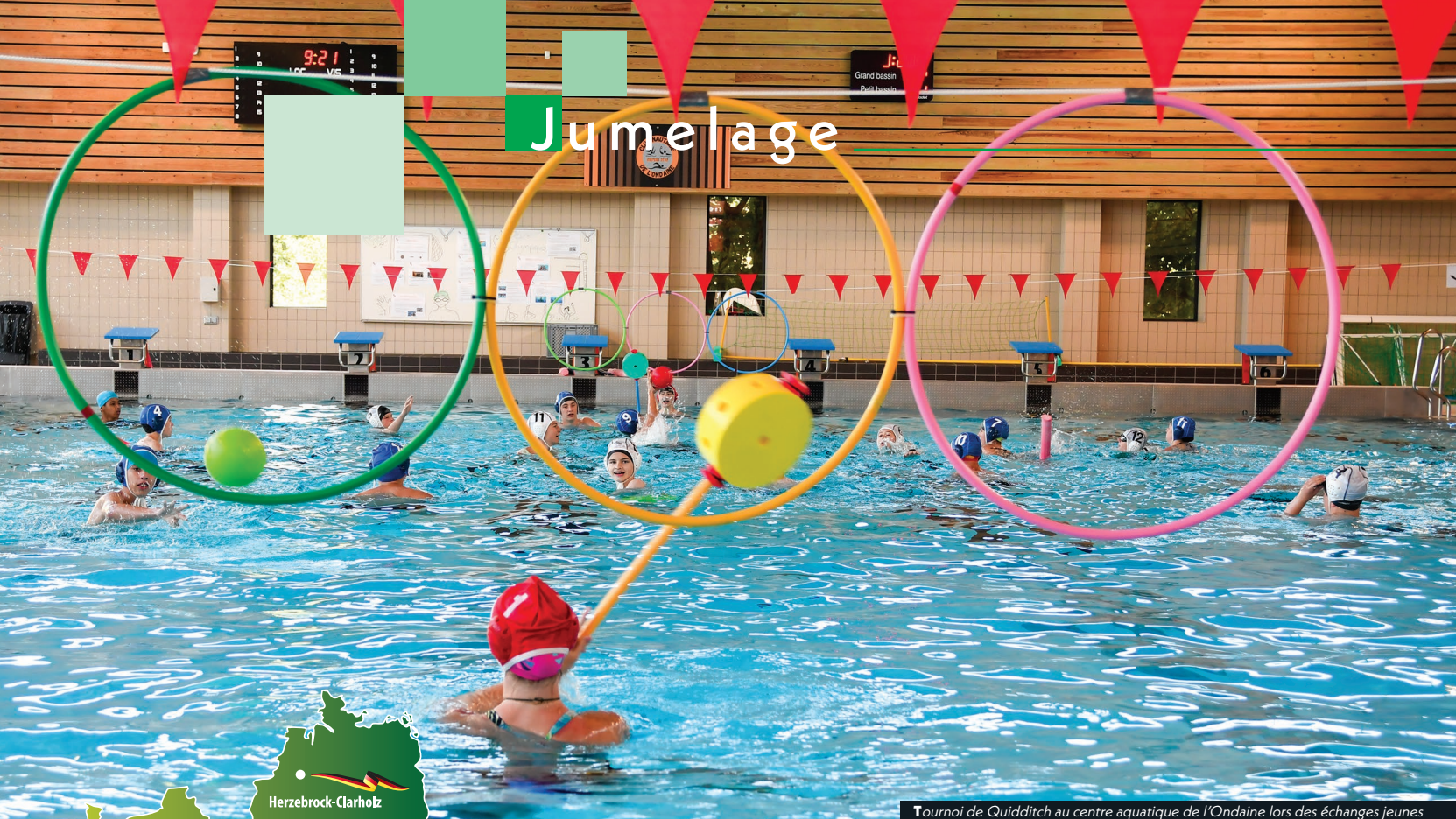
Tournoi de Quidditch au centre aquatique de l'Ondaine lors des échanges jeunes