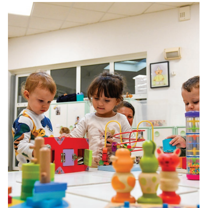
villelechambon Chaque jeudi, la ludothèque municipale s'installe à la crèche Les Picoti pour le plus grand bonheur des enfants, qui découvrent de nombreux jeux !