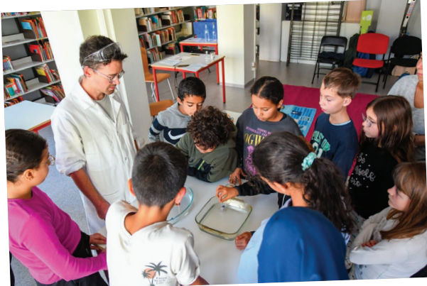
A l'occasion de la fête de la science, de nombreux ateliers et conférences scientifiques adaptés aux plus jeunes étaient organisés à la médiathèque municipale.