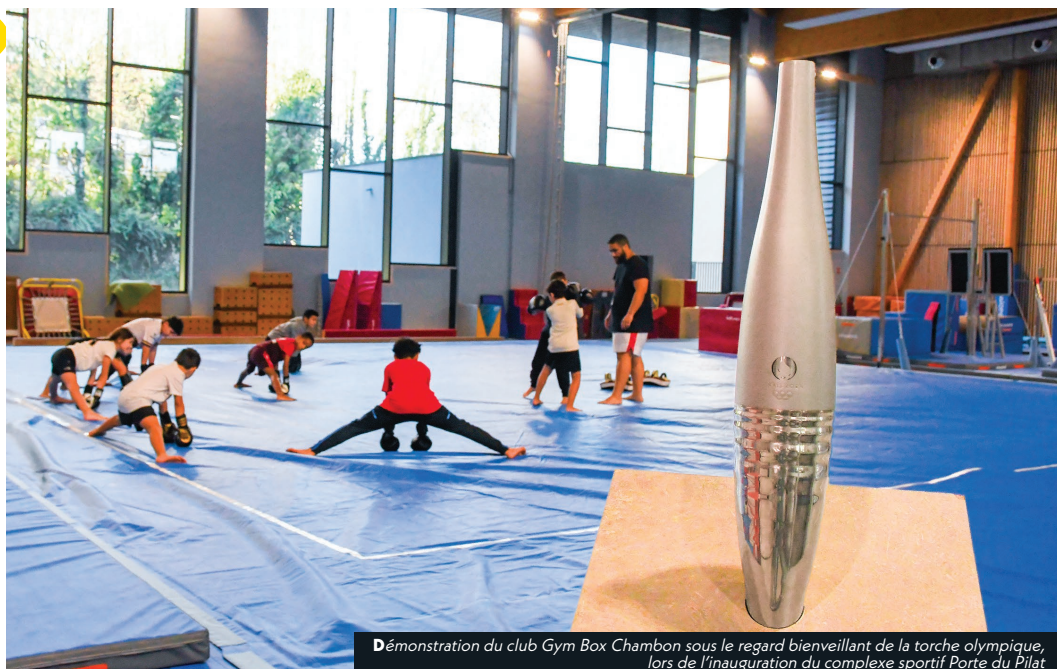
Démonstration du club Gym Box Chambon sous le regard bienveillant de la torche olympique, lors de l'inauguration du complexe sportif Porte du Pilat