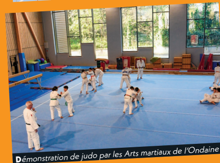
Démonstration de judo par les Arts martiaux de l'Ondaine