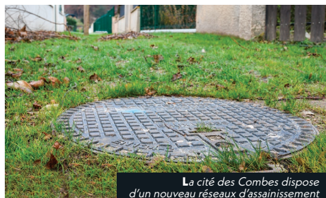
La cité des Combes dispose d'un nouveau réseaux d'assainissement

Du côté de la rue des Rosiers, la reprise des réseaux d'eau potable avance à bon rythme. Ce chantier devrait se terminer fin décembre 2024, améliorant ainsi la distribution et la qualité de l'eau pour les habitants du quartier.