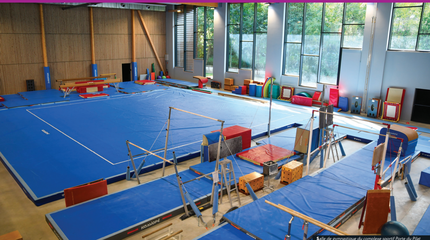
Salle de gymnastique du complexe sportif Porte du Pilat

L'année qui s'achève est marquée par l'aboutissement ou le lancement de projets d'envergures qui renforcent la qualité de vie au sein de notre ville. Qu'il s'agisse de moderniser les infrastructures sportives, repenser les espaces publics, renforcer la présence médicale ou prévenir les risques liés au changement climatique, ces initiatives illustrent un engagement fort résolument tourné vers l'avenir.