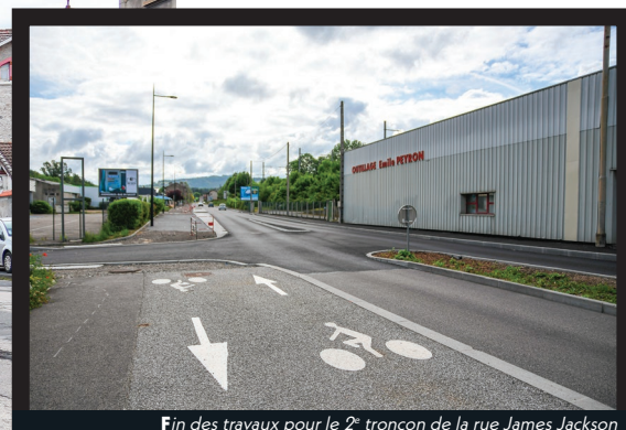
Fin des travaux pour le 2 e tronçon de la rue James Jackson