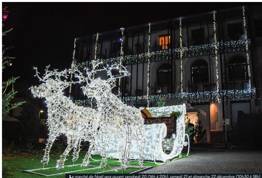
Le marché de Noël sera ouvert vendredi 20 (16h à 20h), samedi 21 et dimanche 22 décembre (10h30 à 18h)