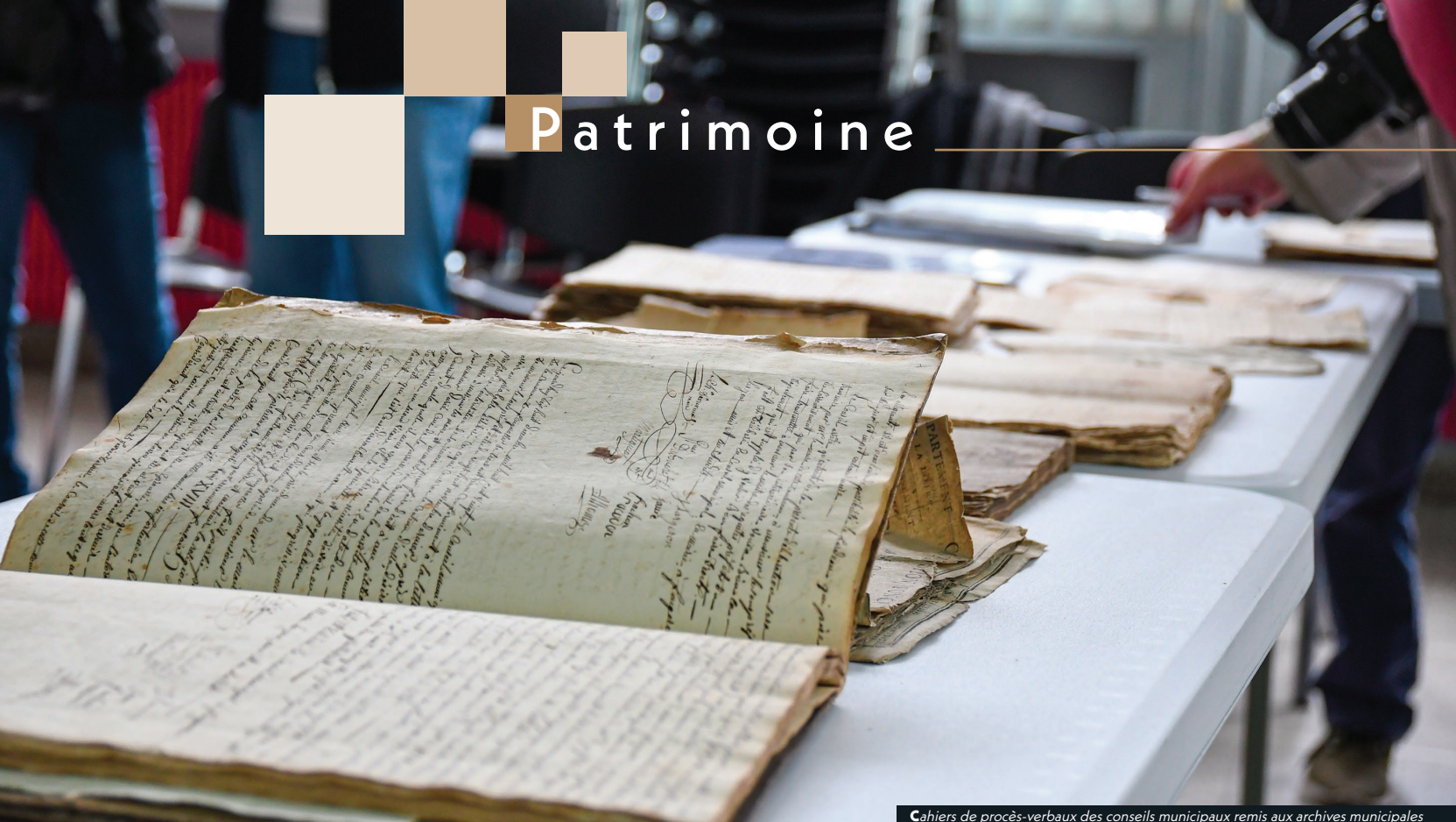
Cahiers de procès-verbaux des conseils municipaux remis aux archives municipales