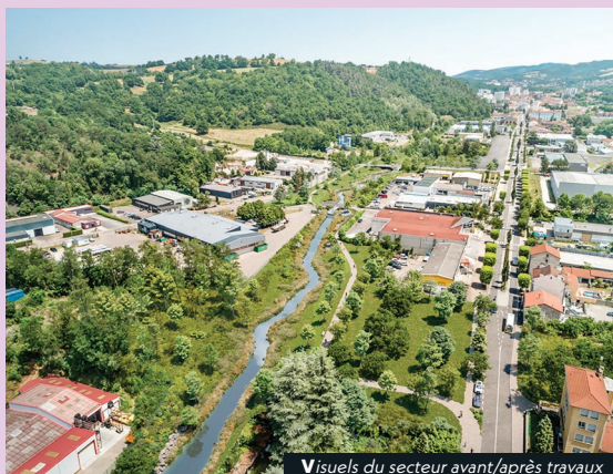
Visuels du secteur avant/après travaux