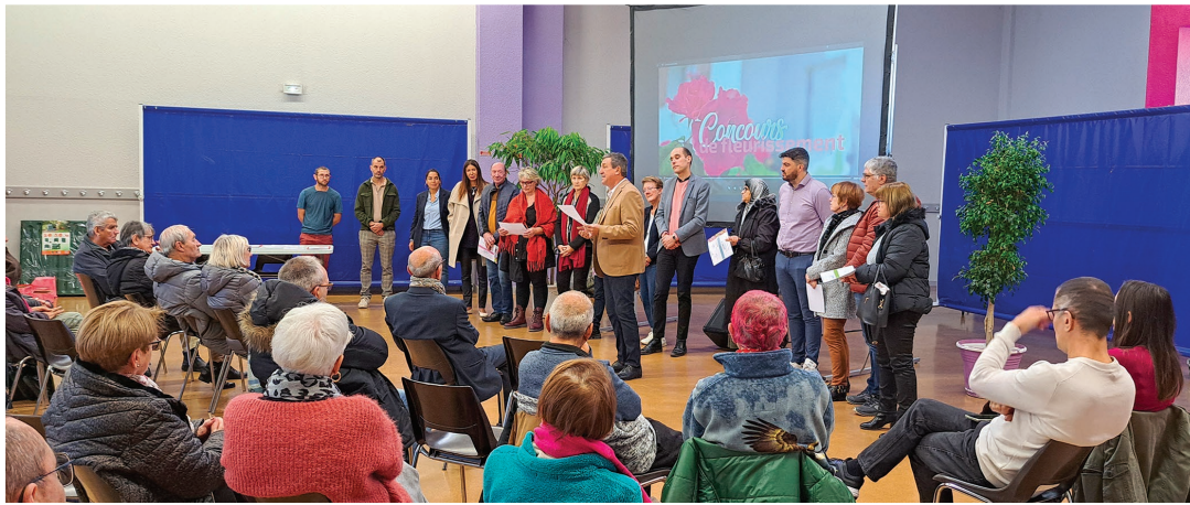
Félicitations à tous les participants du concours « Le Chambon s'embellit », qui ont été récompensés le 16 novembre dernier par la Ville et Habitat & Métropole pour leur implication à fleurir et embellir la commune.