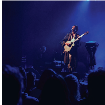
villelechambon La voix envoûtante d'@ayomusic a réchauffé La Forge hier soir. Entre soul, folk et reggae, elle a transporté le public dans un voyage unique, mêlant douceur et intensité.

Il ne vous restera alors plus qu'à publier vos plus belles photos de la ville avec le #monchambon