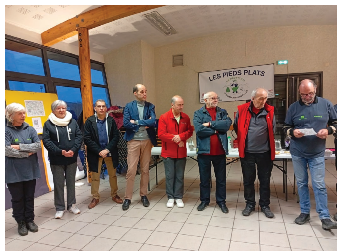
La marche des Pieds plats a rassemblé plus de 730 marcheurs.