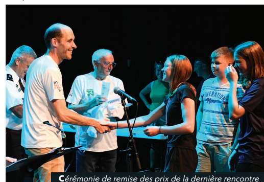
Cérémonie de remise des prix de la dernière rencontre

Des places seront ouvertes aux jeunes Chambonnais âgés de 14 à 16 ans. Les inscriptions seront bientôt ouvertes. Plus d'informations sur le programme prochainement disponible sur lechambon.fr