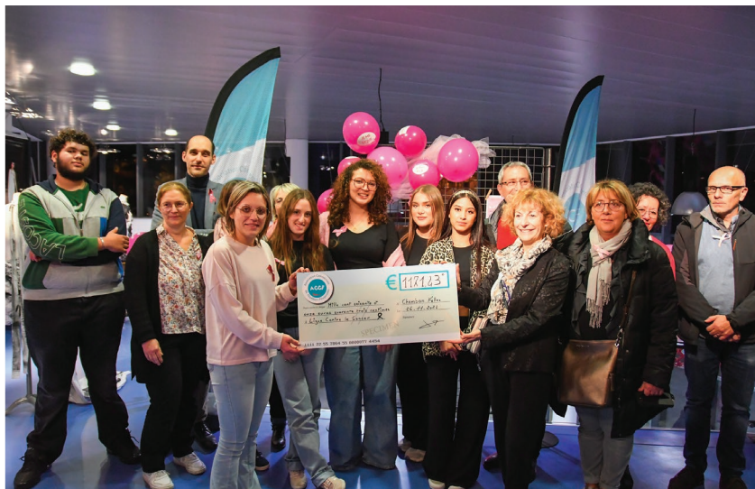
La vente de rubans roses, symbole de la lutte contre le cancer du sein, initiée par l'Association commerciale du Chambon-Feugerolles (ACCF) et du lycée professionnel des métiers de la mode Adrien Testud, a permis de récolter 1171,43€, remis au comité Loire de la Ligue contre le cancer. Un bel engagement pour ces jeunes élèves aux côtés des commerçants.