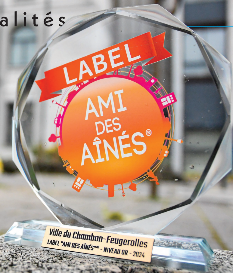
Label « Ami des aînés » niveau Or décerné au Salon des maires de Paris