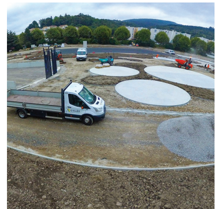
villelechambon Le chantier du futur complexe dédié aux sports et aux loisirs de plein air L'Agora prend forme !