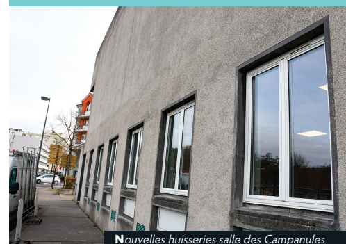
Nouvelles huisseries salle des Campanules

Ces travaux permettront de limiter les déperditions de chaleur, contribuant ainsi à une meilleure isolation thermique du bâtiment. Ce projet vise non seulement à réduire les consommations énergétiques, mais également à offrir plus de confort aux personnes qui fréquentent cet espace.