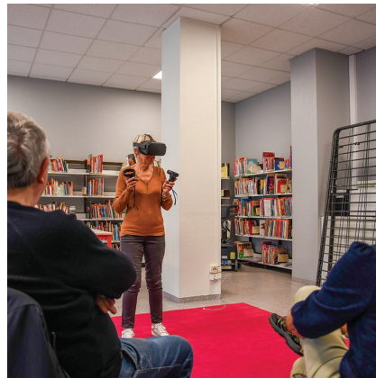
villelechambon Lors d'un atelier découverte organisé par la médiathèque municipale, les participants ont voyagé au cœur du Parc national américain du Grand Canyon ou de la dune du Pilat grâce à un casque de réalité virtuelle.