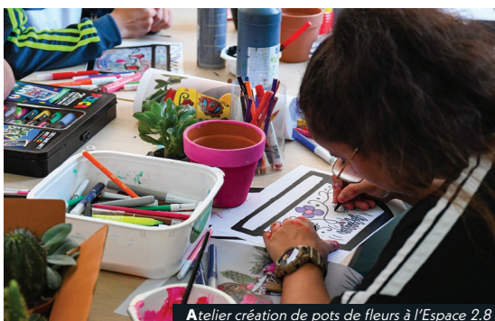
Atelier création de pots de fleurs à l'Espace 2.8

Pour plus d'informations : 04 77 06 12 20 espacejeunesse@lechambon.fr