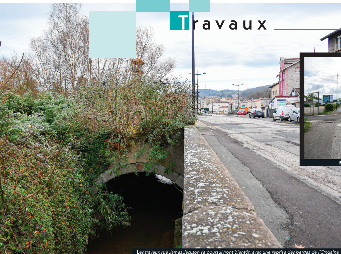
Les travaux rue James Jackson se poursuivront bientôt, avec une reprise des berges de l'Ondaine