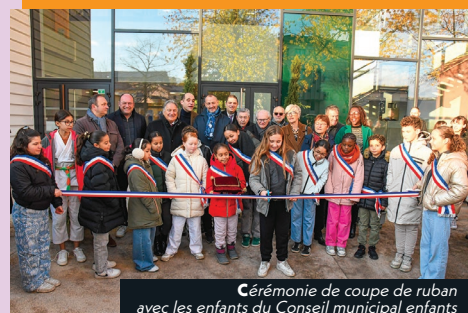
Cérémonie de coupe de ruban avec les enfants du Conseil municipal enfants