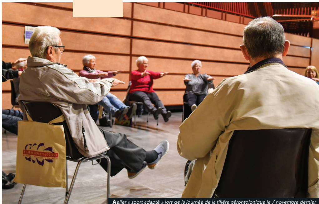
Atelier « sport adapté » lors de la journée de la filière gérontologique le 7 novembre dernier