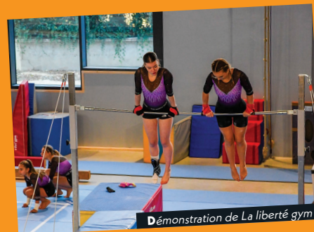
Démonstration de La liberté gym